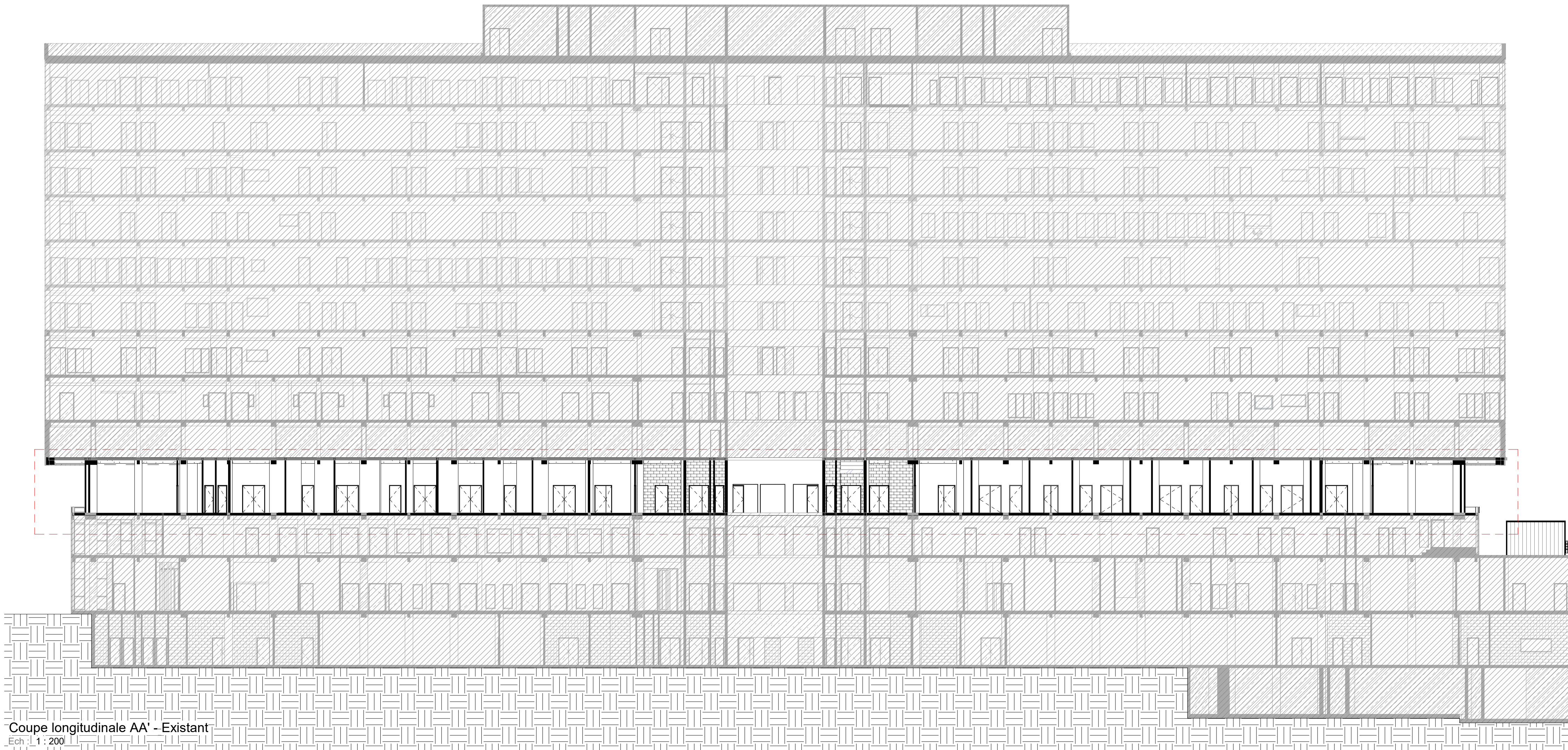
Coupe longitudinale AA' - Existant Ech : 1 : 200